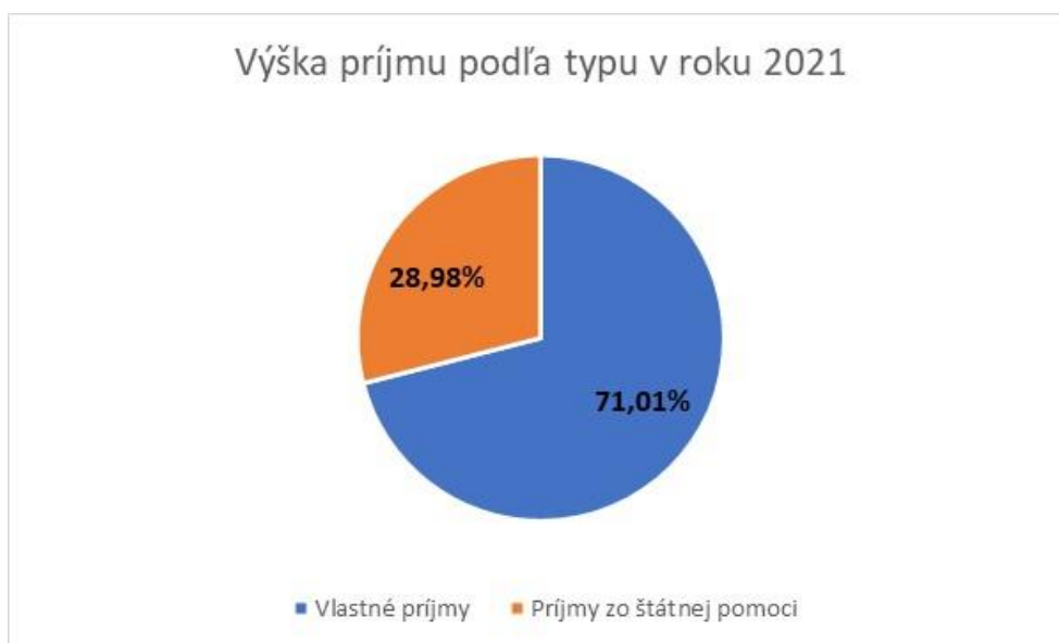
Graf 3 Výška príjmu podľa typu v roku 2021