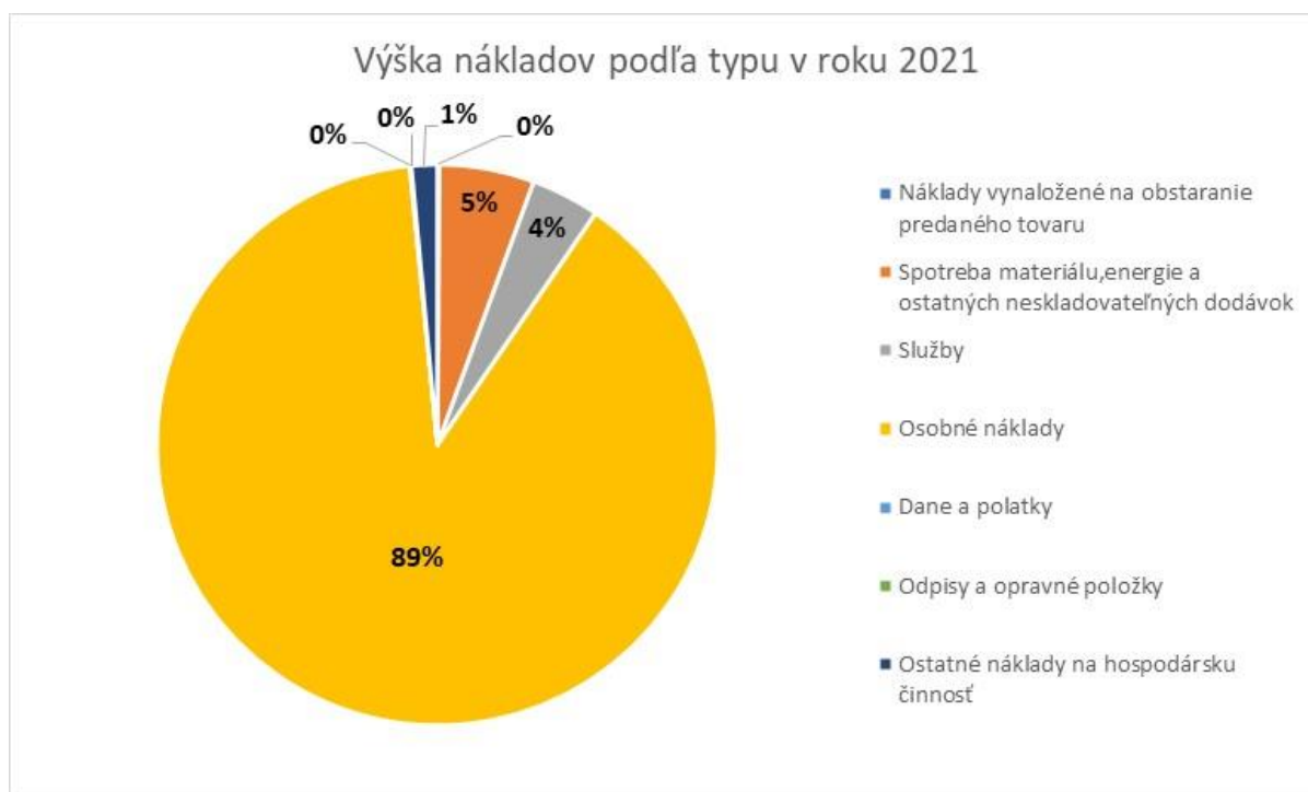
Graf 5 Výška nákladov podľa typu v roku 2021