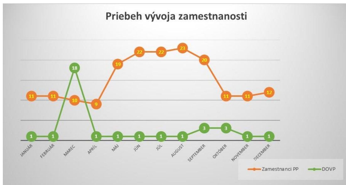
Graf 2 Priebeh vývoja zamestnanosti počas sledovaného obdobia